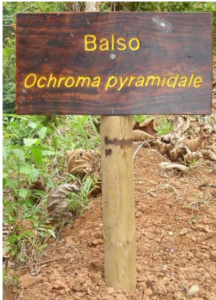
Ochroma pyramidale (Cav. ex Lam.) Urb. (Balsa), presente en varios sitios de Portasol.

Estas fotografías muestran algunos de los trabajos realizados.