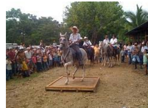
Gente de Portalón y vecinos disfrutando de las actividades.