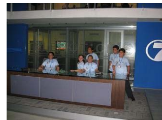
Stand en AmbientICE